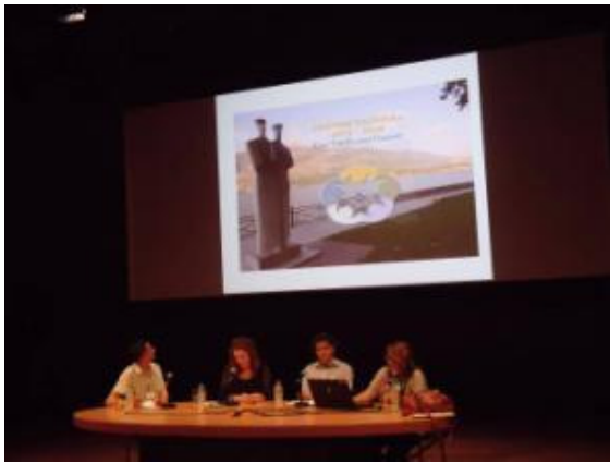
Φωτογραφικό Υλικό από την ημερίδα

Παραδοτέο 13: «Τεκμηριωτικό Υλικό υλοποίησης δραστηριοτήτων προβολής έτους 2013» στο πλαίσιο του υποέργου «Διοργάνωση Θερινών Σχολείων για Έλληνες Μαθητές, μαθητές ευρωπαϊκών κλασικών λυκείων και μαθητές σχολείων της Αμερικής, Αυστραλίας και Ασίας».