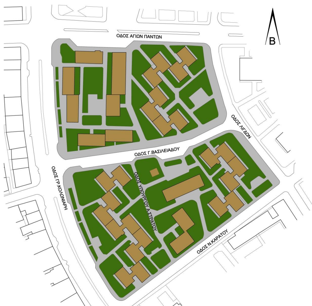
Χώροι πρασίνου στην περιοχή μελέτης

Όπως έχει ήδη αναφερθεί, στην περιοχή μελέτης παρατηρείται αυξημένο ποσοστό πρασίνου σε σχέση με το δομημένο χώρο καθώς και σε σχέση με τα οικοδομικά τετράγωνα της ευρύτερης περιοχής. Παρόλα αυτά δεν παρατηρείται κάποιου είδους χρήση και εκμετάλλευση των χώρων πρασίνου από τους κατοίκους.