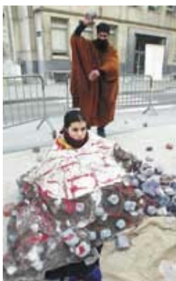
Διαμαρτυρία έξω από κτίριο της Ε.Ε. στις Βρυξέλλες.

Αρχές Μαΐου άρχισε να κυκλοφορεί μέσω ηλεκτρονικού ταχυδρομείου η πληροφορία ότι στις 3 Ιουνίου έχει προγραμματιστεί η εκτέλεση της Αμίνα Λαουάλ. Το μήνυμα ανέφερε ως πηγή δικτυακό τόπο του Ισπανικού Τμήματος της Διεθνούς Αμνηστίας και καλούσε τους αποδέκτες του να υπογράψουν επιστολές διαμαρτυρίας προς τις νιγηριανές αρχές. Σύμφωνα με σχετικό δημοσίευμα της «Γκάρντιαν», μέσα σε ελάχιστο χρονικό διάστημα συγκεντρώθηκαν περισσότερες από πέντε εκατομμύρια υπογραφές (8/5).