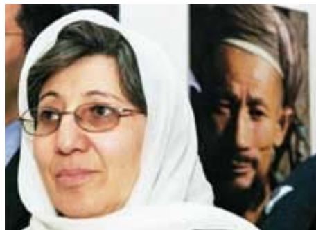
Η τέως υπουργός Σίμα Σαμάρ κατά την περσινή επίσκεψή της στην Ελλάδα. Τώρα, κατηγορείται για προδοσία.

«Οι περισσότερες γυναίκες δεν νιώθουν ασφαλείς όταν βρίσκονται έξω από το σπίτι, παρά το γεγονός ότι η κυβέρνηση της Καμπούλ έχει άρει τους νομικούς περιορισμούς των κινήσεών τους» διαβάζουμε σε πρόσφατη ανακοίνωση σειράς μη κυβερνητικών οργανώσεων, μεταξύ των οποίων η Διεθνής Αμνηστία, η Παναφγανική