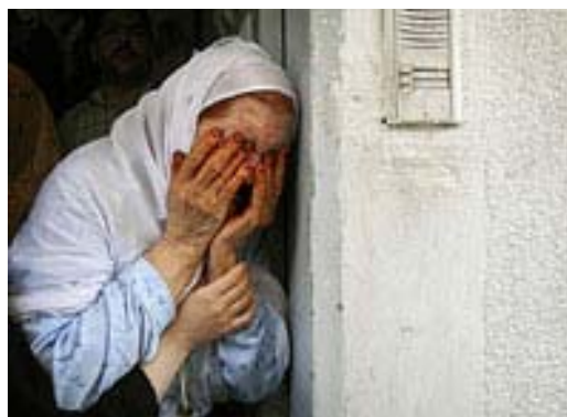
Παλαιστίνιες και Ισραηλινές είναι ίσες μόνο στην καταπίεση που υφίστανται.

Τα θύματα της εσωτερικής οικογενειακής βίας στρέφονται συνήθως στις πολιτικές οργανώσεις. Τοπικοί ηγέτες της Χαμάς, της Φάταχ και άλλων οργανώσεων αναλαμβάνουν να μεσολαβήσουν για την επίλυση των προβλημάτων. Η ισραηλινή κατοχή και η αφόρητη καθημερινή ζωή στα παλαιστινιακά εδάφη ευθύνονται κυρίως για την οικογενειακή βία. Η πίεση την οποία