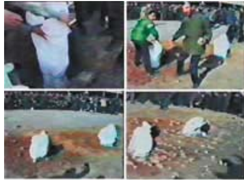
Εικόνες λιθοβολισμού στο Ιράν (1992), τη γνησιότητα των οποίων διέψευσε το ιρανικό καθεστώς.

Αξίζει να σημειώσουμε ότι, όπως αυτοσυστήνεται, η ΜΠΑΟΜΠΑΜΠΙ είναι μια οργάνωση που αγωνίζεται για την υπεράσπιση των δικαιωμάτων των γυναικών, των ανδρών και των παιδιών στο ισλαμικό, το εθιμικό και το κρατικό δίκαιο της Νιγηρίας, κυρίως όμως ασχολείται με άτομα που καταδικάστηκαν με τη νέα ποινική νομοθεσία της Σαρία, η οποία καθιερώθηκε σταδιακά σε ορισμένα (12 από τα 36) κρατίδια της Βόρειας Νιγηρίας τα τελευταία τρία χρόνια.